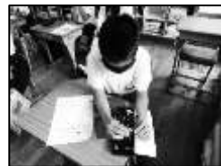
(赤い羽根のいわれも説明しました。)