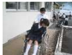
(乗る人が不安にならないように安全な介助を練習。)