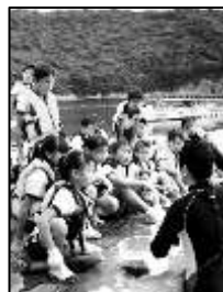
(箱眼鏡でヒトデや貝などたくさん生き物を観察できました。)