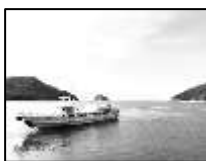
(向こうには小豆島が見える。)