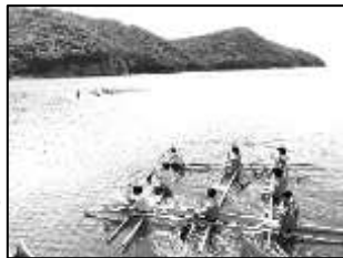
(手作りいかだで出航!)